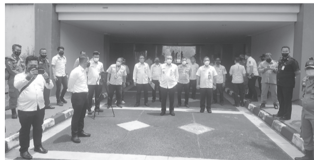
Bupati Tangerang, Ahmed Zaki Iskandar bersama sejumlah wartawan.

TANGERANG (IM) - Ratusan wartawan dan LSM se Tangerang Raya, melakukan aksi damai di depan gedung Pemerintahan Kabupaten Tangerang, Rabu (9/3).